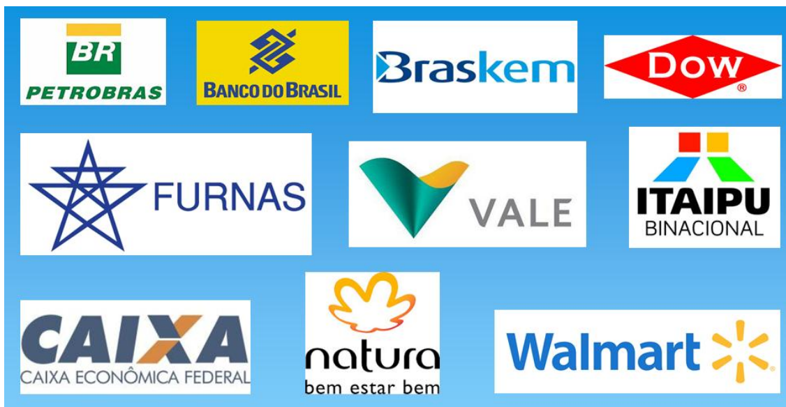
Figura 2. Logo das principais empresas desenvolvedoras de projetos sustentáveis do país.

• Walmart – As ações de sustentabilidade da empresa de supermercados concentram-se em três eixos: clima e energia, resíduos e produtos. Referente ao primeiro ponto, a empresa tenta reduzir em até 30% o consumo de energia dos pontos de venda. Referente ao segundo ponto a empresa implementa estações para o tratamento e reciclagem de todo o lixo produzido pelas unidades de venda, bem como a redução no volume de embalagens. Como último eixo da área sustentável, a empresa busca reduzir em até 70% a presença de fosfato em detergentes e sabões em pó utilizados na limpeza da rede, e também oferecer ao menos um produto orgânico para cada categoria de alimentos comercializada.